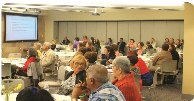
2da. Conferencia Nacional del Pensionado y la Tercera Edad "Aunando esfuerzos colaborativos: Del individualismo a la Solidaridad"