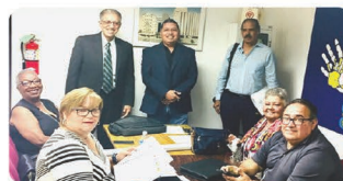
Miembros del Movimiento Pro Pensionados (MPP)