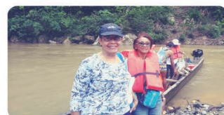
Viaje Cultural a Panamá