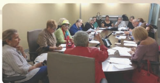
Reunión del Junte de Asociaciones con Pensionados y Jubilados de Puerto Rico