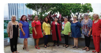
Voluntarias del Comité de Actividades