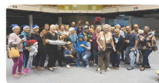
Participantes del encuentro "Nuestro Momento es Hoy" en San Juan