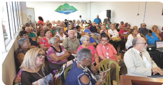
Encuentros Regional de AESA en Rio Grande