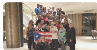
Viaje Cultural a Argentina y Chile