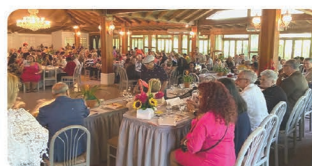
Asamblea Cuadrial de AESA 2019