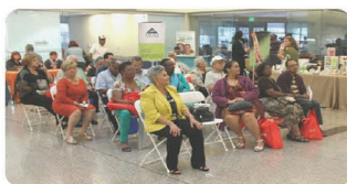
Actividades en el Atrio de Plaza AEELA en la 2da. Conferencia Nacional sobre el Pensionado