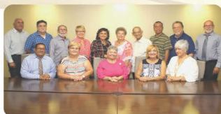
Junte de Asociaciones con Pensionados y Jubilados de PR