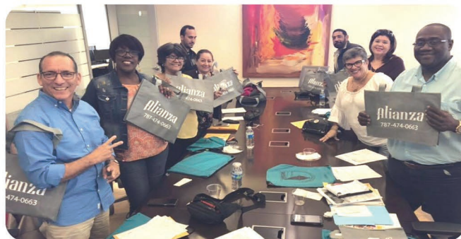
Jubilados de la Autoridad de Desperdicios Sólidos en orientación con la Alianza por la Salud del Pensionado y nuevos afiliados de AESA