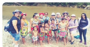
Viaje Cultural a Panamá