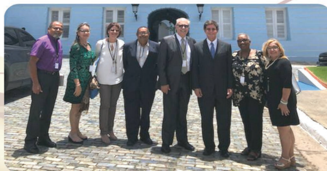
Miembros del Comité Oficial de Retirados (COR), en La Fortaleza