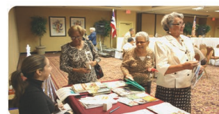
Encuentro con miembros de la Asociación de Pensionados del Gobierno de Puerto Rico Residentes en el Exterior