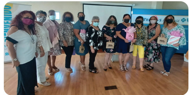
Personal Administrativo con miembros de la Junta de Directores, celebrando el Día del Asistente Administrativo

No queremos pasar por alto un reconocimiento al excelente equipo de trabajo de nuestra oficina, en la celebración de la Semana del Oficial Administrativo.