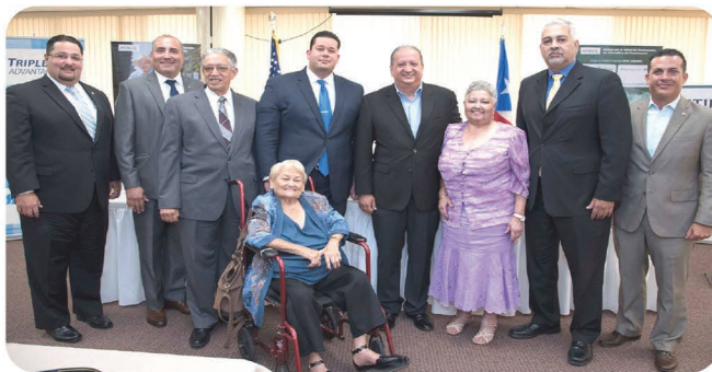
Foto histórica. Los pensionados de Puerto Rico junto a los Administradores de los Sistemas de Retiro y las Aseguradoras.