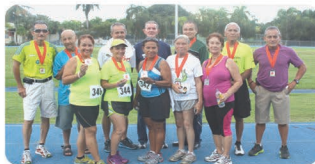
3K Córrelo o Camínalo con AESA (San Juan, Puerto Rico)

Destacamos los logros más significativos de los últimos años: