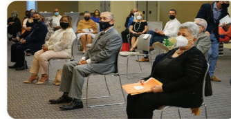
Homenajeado junto con otros participantes