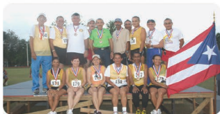
5K Córrelo o Camínalo con AESA (Caguas, Puerto Rico)