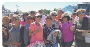
Viaje Cultural con AESA