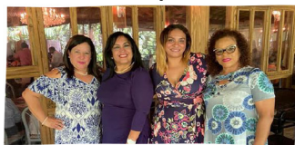
Equipo de Oficina