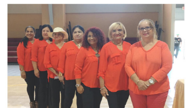
Comité Socio Educativo y de Deportes