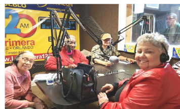
Programa Radial Kissimmee, Florida

Como toda las instituciones y asociaciones a nivel mundial, AESA, ha tenido un año atípico por los desastres atmosféricos, que nos han cambiado el modo de convivencia, tanto en el orden familiar, como agencial y público en general. Sin embargo, AESA continuó llevando a cabo muchas de las actividades del plan de trabajo; ofreciendo el servicio a nuestros pensionados y jubilados, aún en medio de la pandemia nos hemos reinventado y seguimos trabajando a través de las redes sociales, con el mismo interés y entusiasmo que siempre lo hemos hecho. En este folleto podrás encontrar algunas actividades reprogramadas que se estarán ofreciendo a partir de agosto por las redes sociales. Búscanos en facebook.com/aesapr o envía mensaje de Whatsapp al 787-568-9208 para ser añadido en nuestra lista de difusión y recibas notificación de las próximas actividades.